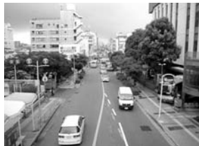
電線等地中化した所

私は以前電線等の地中化について本会議において質問しました。その時点では南茨木駅付近で電線等の地中化を行っていましたが、その後予算がつかない事もあり、茨木市の町の道路改良に伴う電線等の地中化は進んでいません。歩道上の電柱は道幅を狭め、歩行者だけでなくベビーカーや車いすの通行の妨げになることがあります。歩道の幅員を確保するとともに、電線類を地中化して、歩行空間のバリアフリー化をもっと進めてほしいものです。また景観の向上につながるが、安全で快適な都市空間を形成し、地域の活性化につながります。平成7年1月に発生した阪神大震災においては、電柱が倒壊し人々の生活に大きな影響を与えました。このとき最も被害の大きかった神戸地区の電話回線ケーブルの被災率は、架空線が2.4%、地中線が0.03%と、地中線の被害が架空線の80分の1程度にとどまりました。こうした経験を活かし、電線類の地中化により安定したライフラインを実現してほしいです。