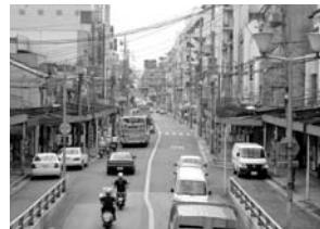
電線等地中化していない所